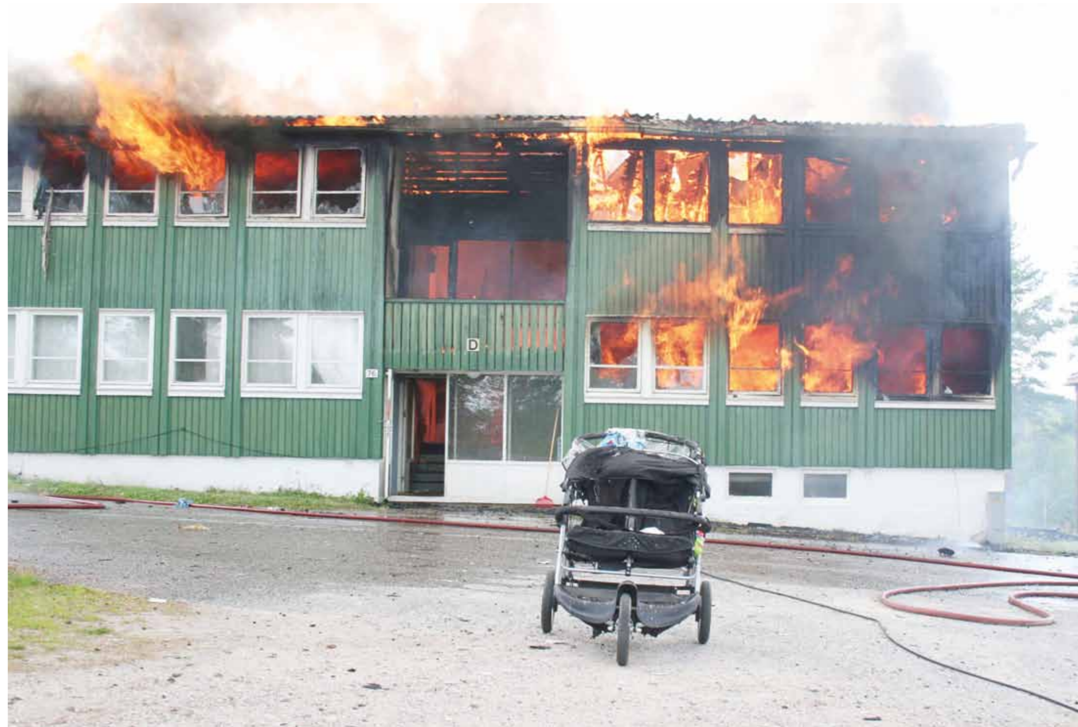
BRANN: Dagrudheimen asylmottak i Nome kommune brant ned til grunnen i juli 2008. Ingen ble skadet da, men en rekke asylsøkere har dødd i brann de senere år.

Fjorårets tall var en femdobling av antal-