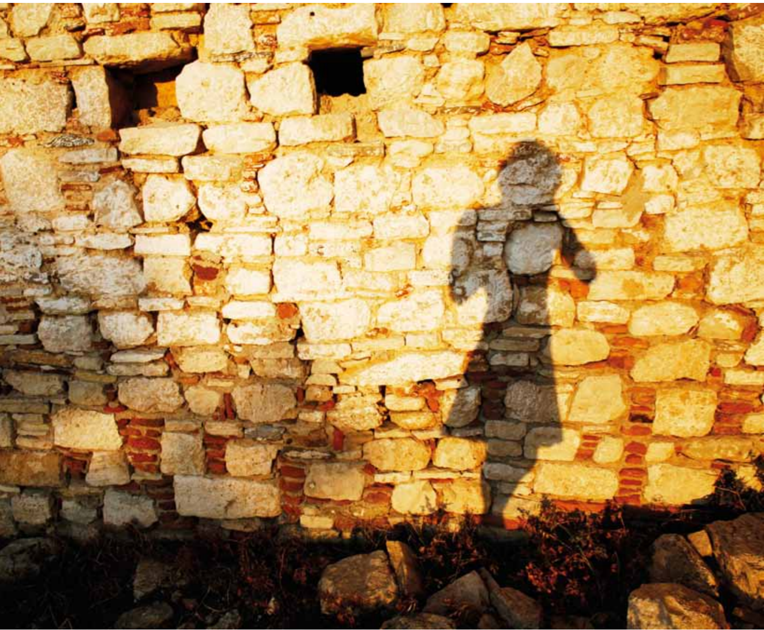
SELVMORD: I januar tok en 24 år gammel kvinnelig asylsøker livet av seg. Nå etterlyser Venstre og NOAS økt granskning av forholdene ved asylmottakene.

spesiell måte. Det sto flere komfyre på gulvet,» uttalte mottaksleder til VG. Og han fortssatte: «Det har gått klart frem for oss i ettertid at komfyren burde ha vært sikret. Vi kommer til å se på våre sikkerhetsrutiner etter dette.»