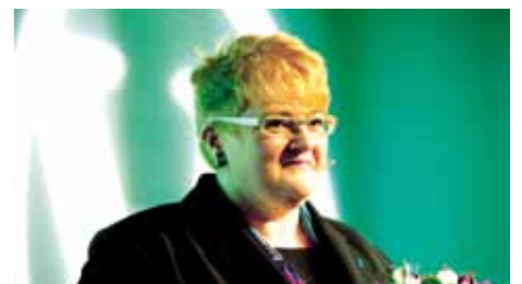
VENSTRE-LEDER: Trine Skei Grande.