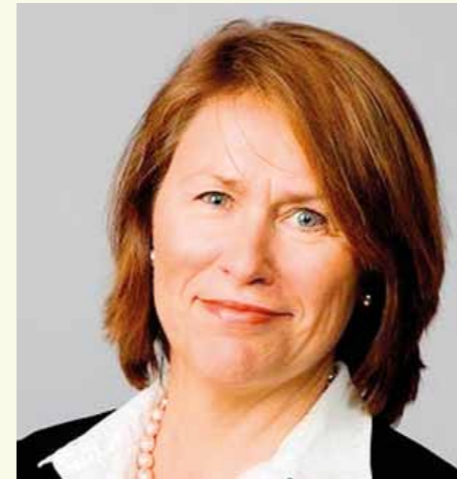
JUSTISMINISTER: Grete Faremo.

Naturlig. Ny Tid har de siste dagene gjentatt ganger forsøkt å få kommentar fra politisk ledelse i Justisdepartementet