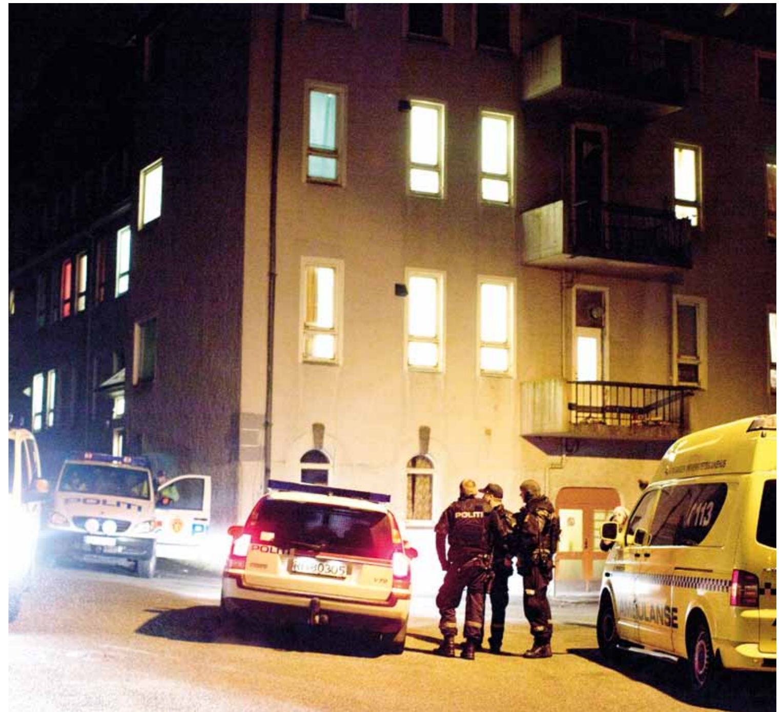
DRAP: Rett etter Valentinerdagen 14. februar ble en gutt stukket med kniv og drept på asylmottaket på Dale i Sandnes, Rogaland fylke. Politi og ambulanse på stedet.