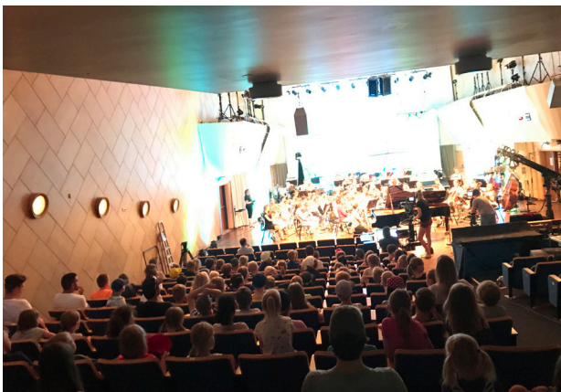
2000 tredjeklassinger besøker KORK hvert år