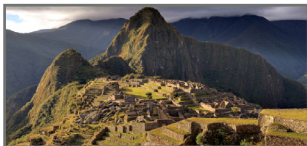
Inkabyen Machu Picchu i Peru