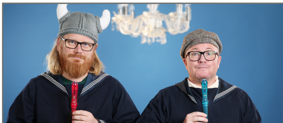
Larsen og Sundnes

Klassisk vorspiel er på tur, og denne gangen til Pers egen by. Elsket og utskjelt, det legendariske programmet på NRK klassisk er kjent for fantastisk musikk, fjonge gjester og verbale sleivspark. Vil de også klare å få Bodø-publikummet til å spille blokkfløyte?