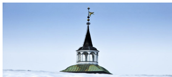
Bergstadens Ziir