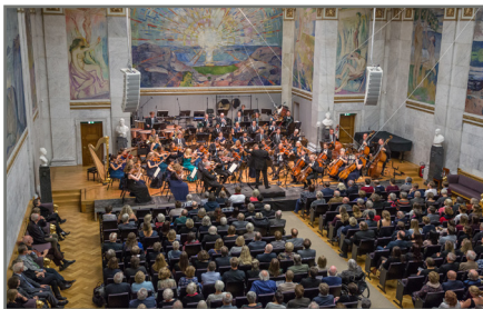
KORK i Aulaen/Foto: Per Ole Hagen/NRK