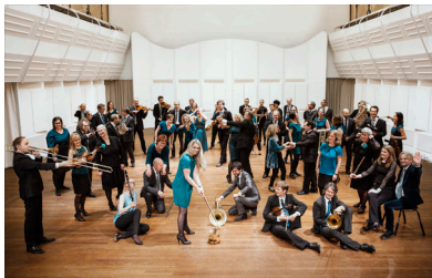
Orkester uten dirigent

Nå er turen kommet til nok en stor symfoni av Brahms. Å spille i orkester er en kollektiv sak, men det er som tanken om felles ansvar for musisering skrur til et par hakk under dirigentløse tilstander, en intensitet vi unner deg opplevelsen av.