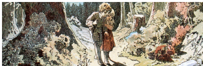
Hans og Grete/Alexander Zick (1845-1907)