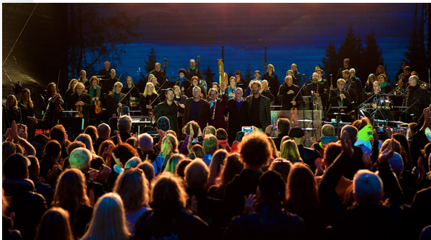
Kringkastingsorkestret og deLillos for første gang sammen på Frognerseieren Amfi i august 2017